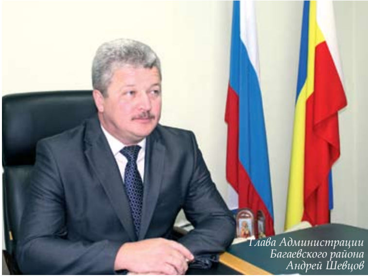
Глава Администрации Багаевского района Андрей Шевцов