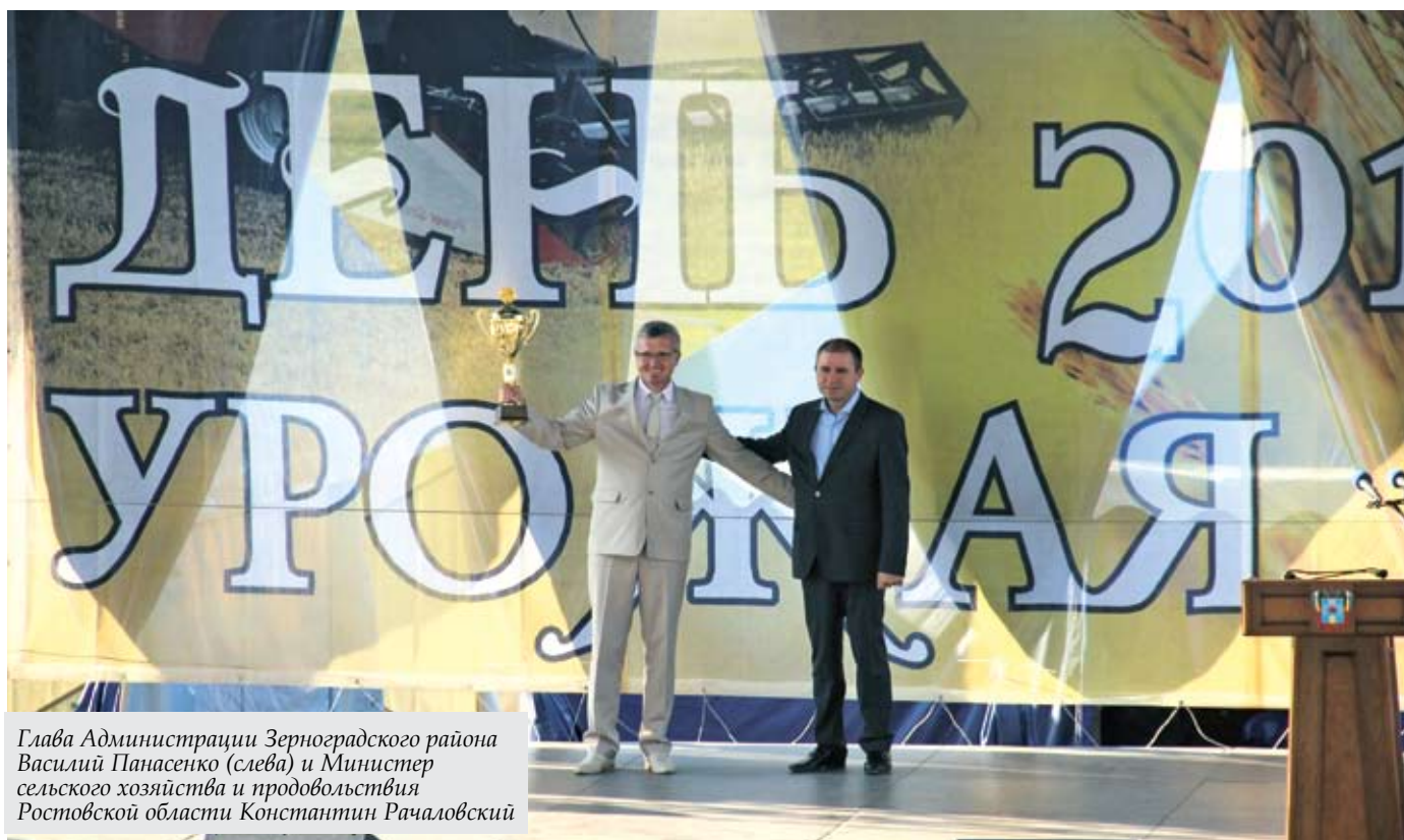
Глава Администрации Зерноградского района Василий Панасенко (слева) и Министр сельского хозяйства и продовольствия Ростовской области Константин Рачаловский